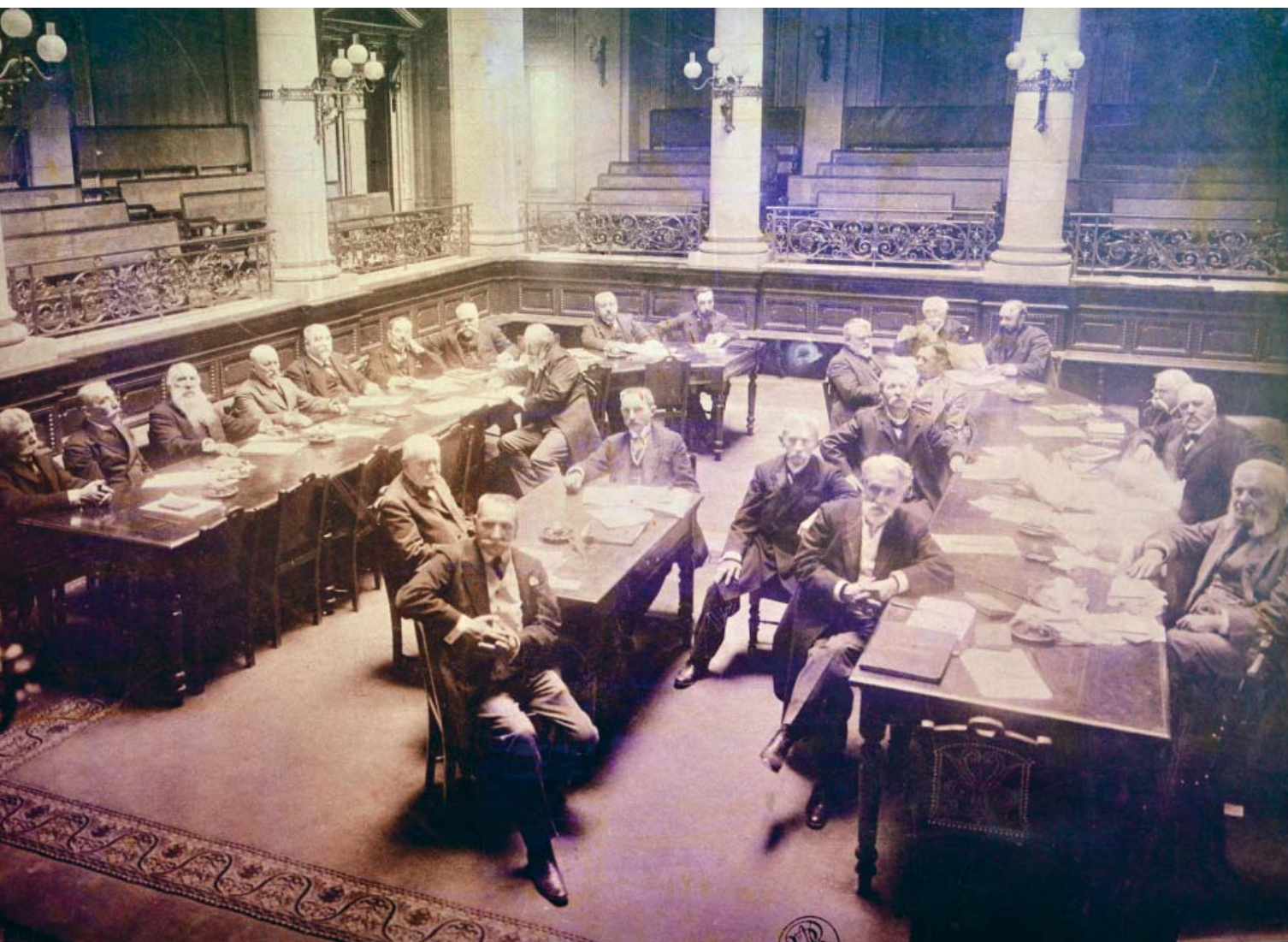
Aula Academiei Române - 1912

Domnule președinte, vă mulțumim pentru amabilitatea de a ne oferi un interviu având în vedere agenda dumneavoastră extrem de încărcată.