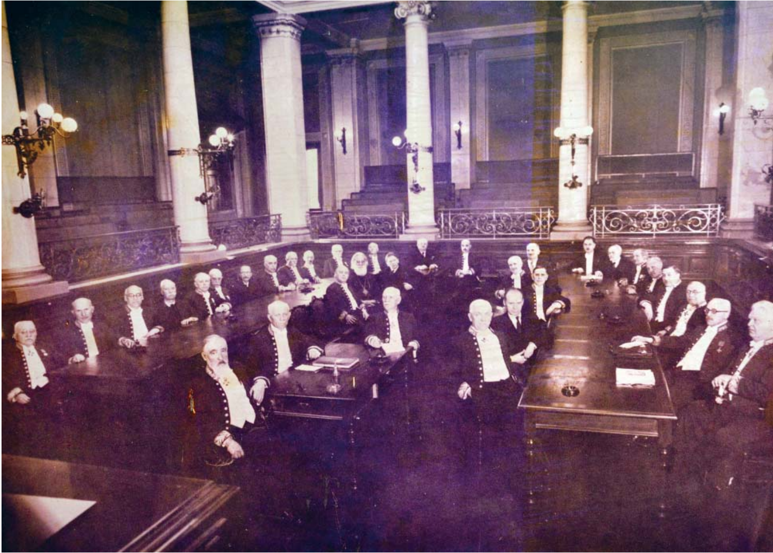
Aula Academiei Române - 1940