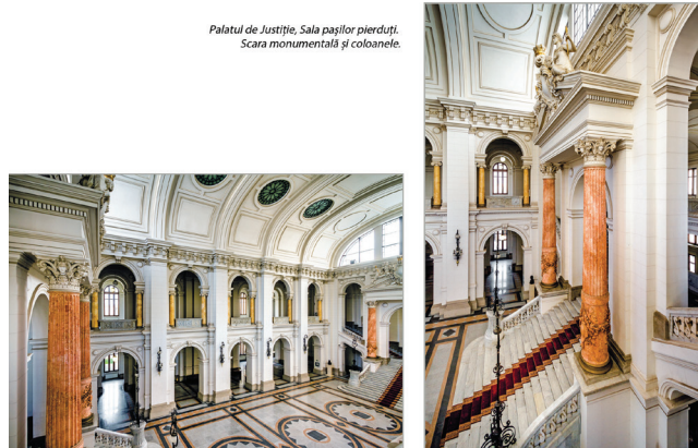
Palatul de Justiție, Sala pașilor pierduți. Scara monumentală și coloanele.

În scopul de a se asigura o calitate corespunzătoare a lucrărilor, condițiile de licitație prevedeau câteva măsuri. Astfel, concurenții erau obligați ca, înainte cu zece zile de data stabilită pentru licitație, să trimită probe de cărămidă, de piatră și ciment la direcția lucrărilor palatului. Și aceste probe, așa cum reiese din documentele pe care prezentăm, au fost încercate în Laboratorul Școlii de poduri și șosele înființate de profesorul inginer Alfons Saligny. Deoarece la data fixată pentru licitație, 15 decembrie 1886, nu s-au prezentat concurenți, Ministerul Justiției anunță în Monitorul Oficial Nr. 209 din 18 decembrie 1886 că „s-a amânat licitația pentru ziua de 21 februarie 1887”. Între timp, Ministerul Justiției anunță, în Monitorul Oficial din 17 ianuarie 1887, organizarea licitației și pentru „Darea în întreprindere a lucrărilor de fier și lemn pentru pardoseli și acoperiș” pentru data de