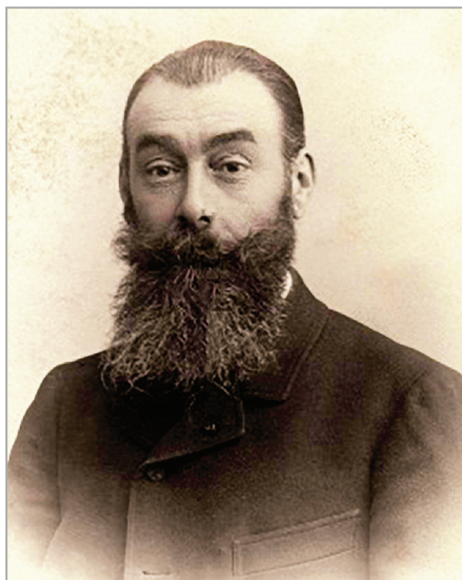
Arhitectul Albert Ballu.

Consolidările s-au concentrat la corpurile de legătură tip B, unde s-au realizat tuburi de beton armat (cu pereți de 35 cm) de rigidizare a structurii. La structura Sălii pașilor pierduți s-a realizat consolidarea individuală a pilaștrilor din axul A și B, prin realizarea în gabaritul lor a unor elemente verticale de beton armat, inclusiv a unor legături orizontale. S-au consolidat pereții portanți de zidărie de cărămidă din axele A, B și 1 și 10. La acoperișul Sălii pașilor pierduți s-au consolidat arcele luminatoarelor din axul 3 și 8 prin armare. De asemenea, s-au consolidat fermele metalice ale acoperișului. În vederea executării proiectului de consolidare, s-a decis ca întreaga clădire să fie