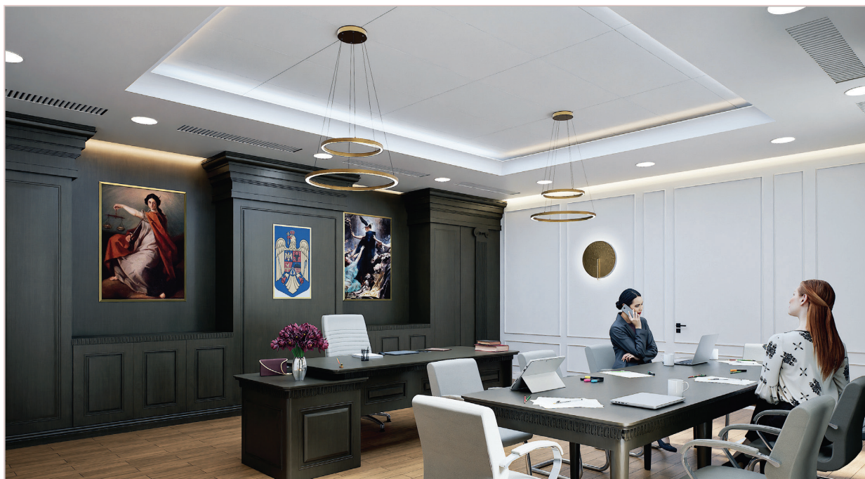
Biroul președintelui instanței supreme

s-a apelat la firma de proiectare „Construcții Erbașu S.A.”, care a întocmit documentația sub coordonarea șefului de proiect arhitect Gabriel Dumitrache.