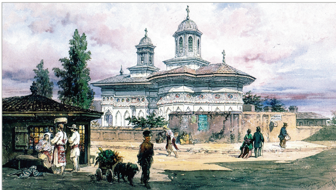
Biserica Batiștei, acuarelă realizată de Amedeo Preziosi în anul 1869

etatea statului și este dat în administrarea Curții Supreme de Justiție. Clădirea fiind executată în anii 1939-1940, s-a hotărât consolidarea acesteia conform normelor de proiectare seismică din anul 1998, precum și amenajarea și dotarea sa cu cele necesare pentru a servi ca sediu al Curții Supreme de Justiție.