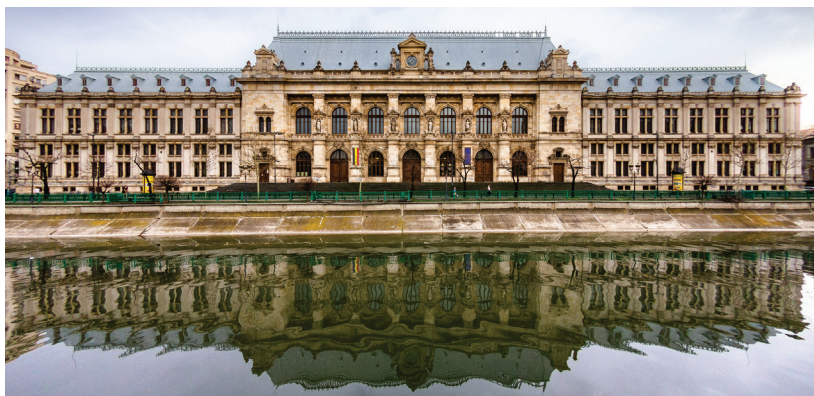
Fațada Palatului de Justiție reflectată în apa Dâmboviței