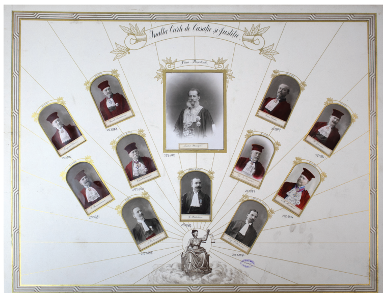
Membrii Înaltei Curți de Casație și Justiție în anul 1906