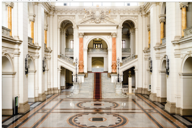
Palatul Justiției, Sala pașilor pierduți (imagine actuală).

19 martie 1887. Se arată că valoarea lucrărilor se urca la 284.919 lei.