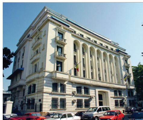
Sediul Înaltei Curți de Casație și Justiție din strada Batiștei nr. 25

La începutul anului 1895 vor începe și lucrările de finisaje interioare, speciale. Astfel, pentru a putea încredința lucrările de tencuiele decorative interioare pe pereți și plafoane la Sala pașilor pierduți, la galeriile din jurul ei, la sălile de consiliu, la sălile de audiențe etc., acestea fiind niște lucrări de artă cu totul speciale, arhitectul Ion Mincu a înaintat desenele necesare și a cerut prețurile executării acestora „numai la anume oameni speciali ce cunosc în țară”.