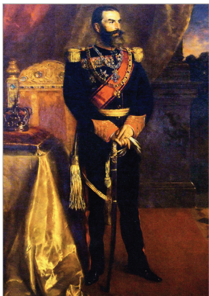
Regele Carol I al României (1866-1914)