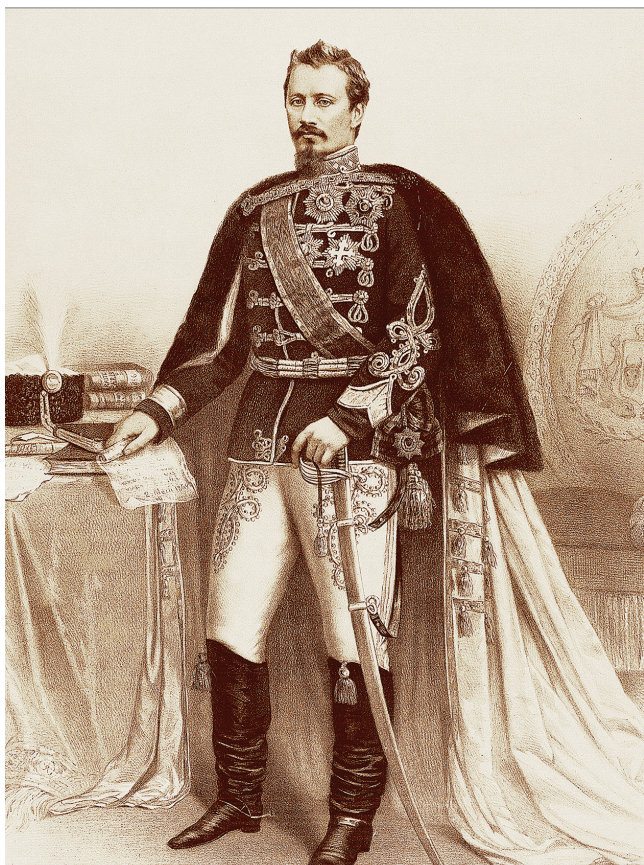
Alexandru Ioan Cuza (1820-1873)

La 10 octombrie 1886, Monitorul Oficial publica anunțul ministrului de Justiție prin care se anunța că, în ziua de 15 decembrie 1886, se va ține licitația pentru „darea în antrepriză a lucrărilor de terasamente, zidărie, pavagiu, marmurărie ordinară, mozaic și lucrări hidraulice.” Suma totală la care se ridicau lucrările era estimată la 2.100.000 lei.