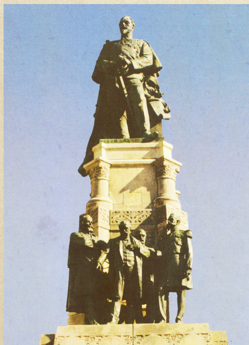
Statuia lui Cuza Piața Unirii, Iași