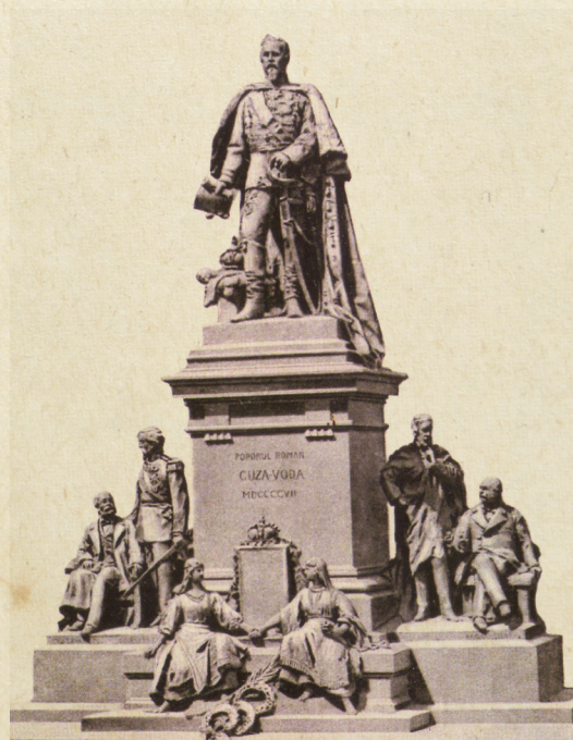
Cuza - Vodă Muzeul Unirii, Iași