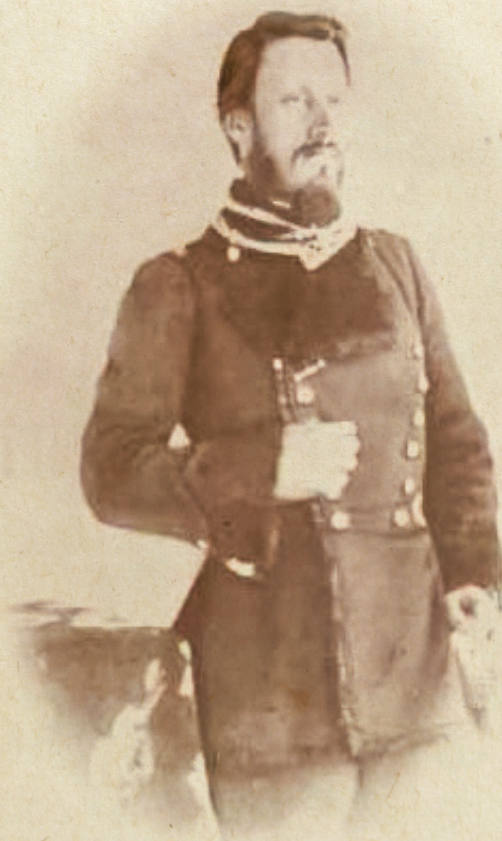
Alexandru Ioan Cuza