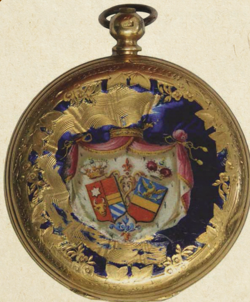
Ceas de buzunar cu stema din 1859