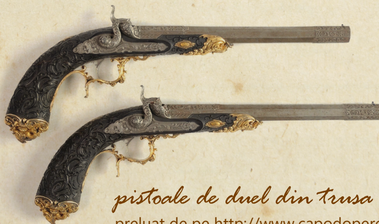
pistoale de duel din trusa lui Cuza