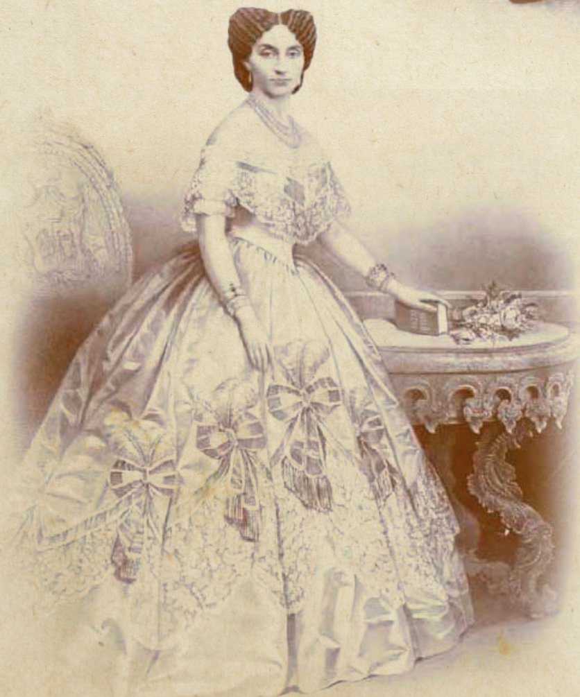
Principesa Elena Cuza