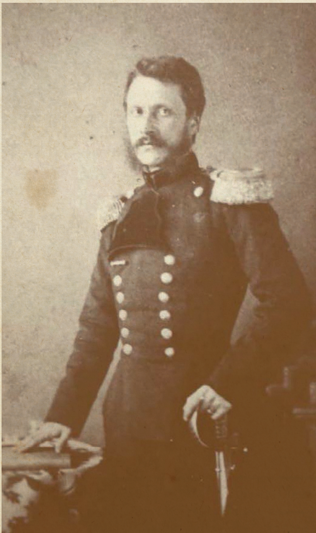
Alexandru Ioan Cuza