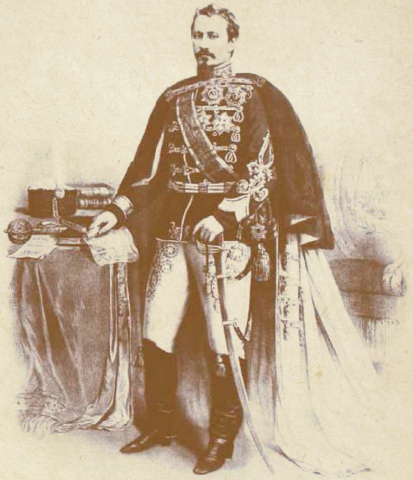
Alexandru Ioan Cuza Principele Românilor