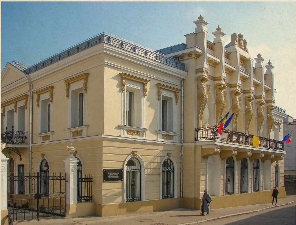
Casa lui Cuza din Iași

(Auzită de P. Gheorgheasa, învățător, comuna Broșteni – Suceava). L. Mrejeriu, S. T. Kirileanu, Gh. Popescu-Vânători, p. 110.