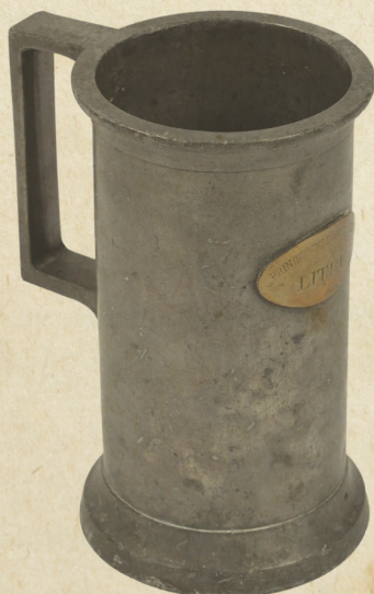
Ocaua etalon pentru lichide

C. Râureanu, „Vodă-Cuza. Pilde și întâmplări din viața sa.“, București, f. a., p. 18.