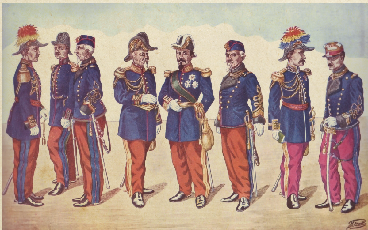
Uniformele armatei din Țara Românească, model 1860

L. Mrejeriu, S. T. Kirileanu, Gh. Popescu-Vânători, p. 161-162.