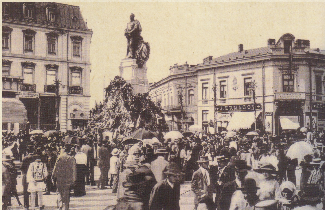
inaugurarea statuii lui Alexandru Ioan Cuza