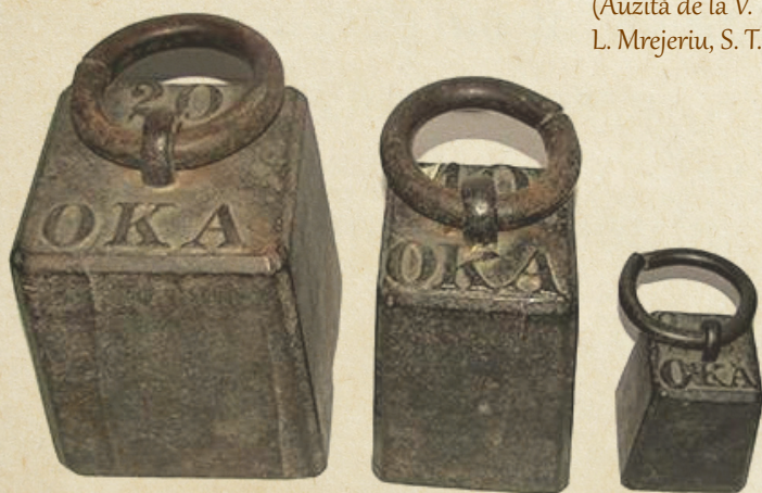
Ocalele etalon de greutate

L. Mrejeriu, S. T. Kirileanu, Gh. Popescu-Vânători, p. 102-103.