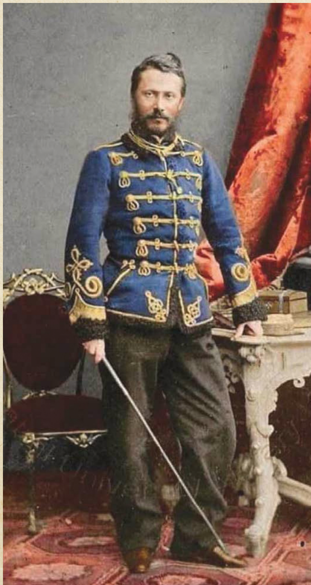
Alexandru Ioan Cuza în ulancă de cavalerie, foto colorizat

Porțile castelului se deschiseră repede și ucigașul fu dat afară singur, dintre toți ce nu... erau acolo decât din greșeală sau din presupusuri.