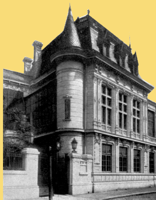
INSTITUTUL DE ETNOGRAFIE ȘI FOLCLOR „C. BRĂILOIU”

Reproducere din volumul lui Frédéric Damé, Bucarest en 1906 , București, Socec & C-ie, 1907 („Hôtel de M. Take Ionescu, Ministre des Finances en 1906. Strada Cătun, 25”).