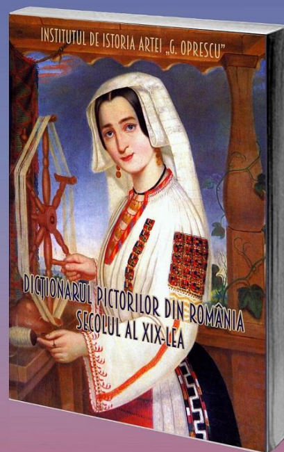
Dicționarul pictorilor din România. Secolul al XIX-lea