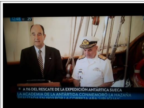
Foto 2. Contraaamiralul de Flotilă Marcelo Tarapow, în uniformă, în timpul ceremoniei.

https://www.clarin.com/sociedad/rescate-historico-homenajes-116-anos-salvataje-expedicion-sueca-antartida_0_kc1o6Tam.html