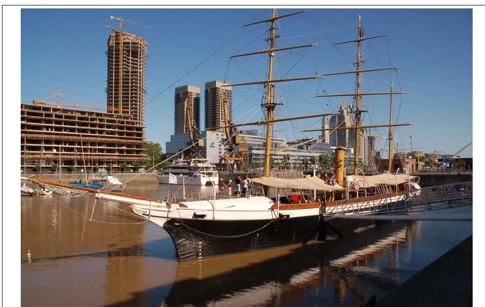
Foto 5. Corveta muzeu ARA Uruguay , acostată în Puerto Madero, Buenos Aires, Argentina (ARA: "Armada de la Republica Argentina", Marina Republicii Argentina).

Evenimentul din 8 noiembrie a.c. celebrat în Argentina la Buenos Aires, pe nava muzeu Corveta ARA Uruguay , ca și inițiativa noastră de realizare a unui tablou dedicat operațiunii de salvare efectuată în Antarctica de Corveta Uruguay în 1903, au creat oportunitatea atractivă de documentare asupra Insulei Paulet - un con de zgură, cu un diametru de 1,5 km, înalt de 353 m, cu un crater în vârf unde s-a format un mic lac cu apă dulce frecventat de pinguini, data ultimei erupții fiind necunoscută, estimându-se însă că ar fi avut loc acum 1.000 de ani. Lipsită de gheață sub efectul căldurii geotermale și cu solul puternic colorat în roz de excrementele pinguinilor, insula primește la țărm masele de gheață care plutesc pe apă, desprinse de pe insulele învecinate.